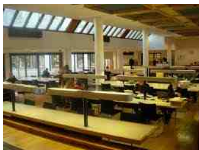
Studiezaal Nationaal Archief

In de archieven in Nederland is het meestal wel een drukte van belang. De studiezalen zijn echter niet gevuld met professionele historici werkend aan een nieuwe publicatie of een promotie-onderzoek. Het overgrote deel van de archief bezoekers in Nederland bestaat uit mensen die onderzoek doen naar de geschiedenis van hun eigen familie, ze maken een 'stamboom'.